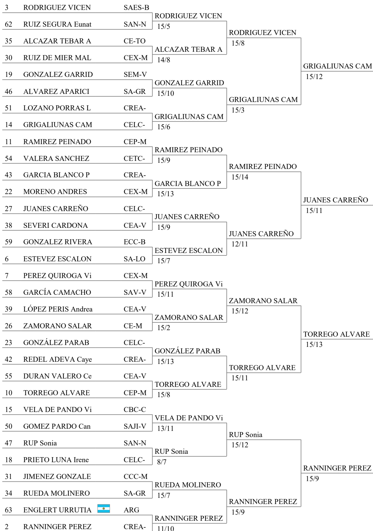
Tableau of 16