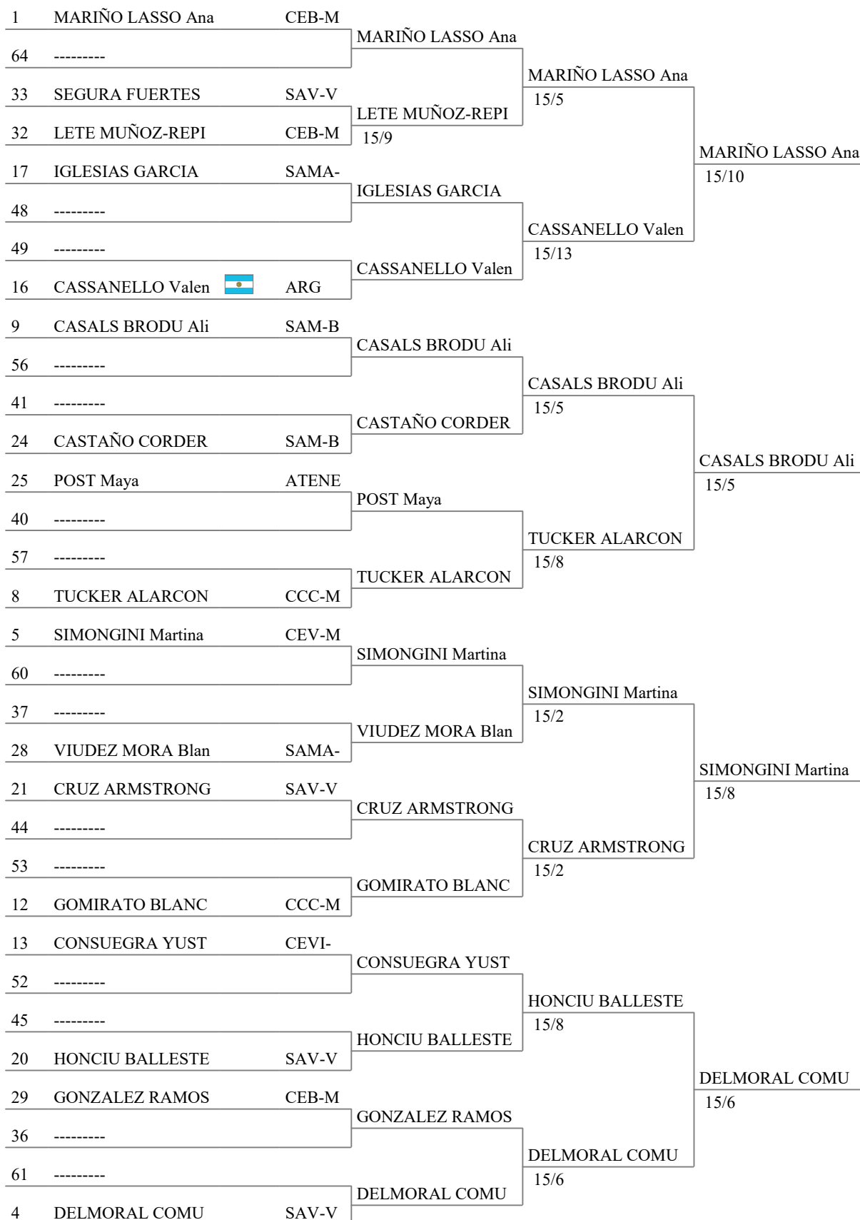
Tableau of 16