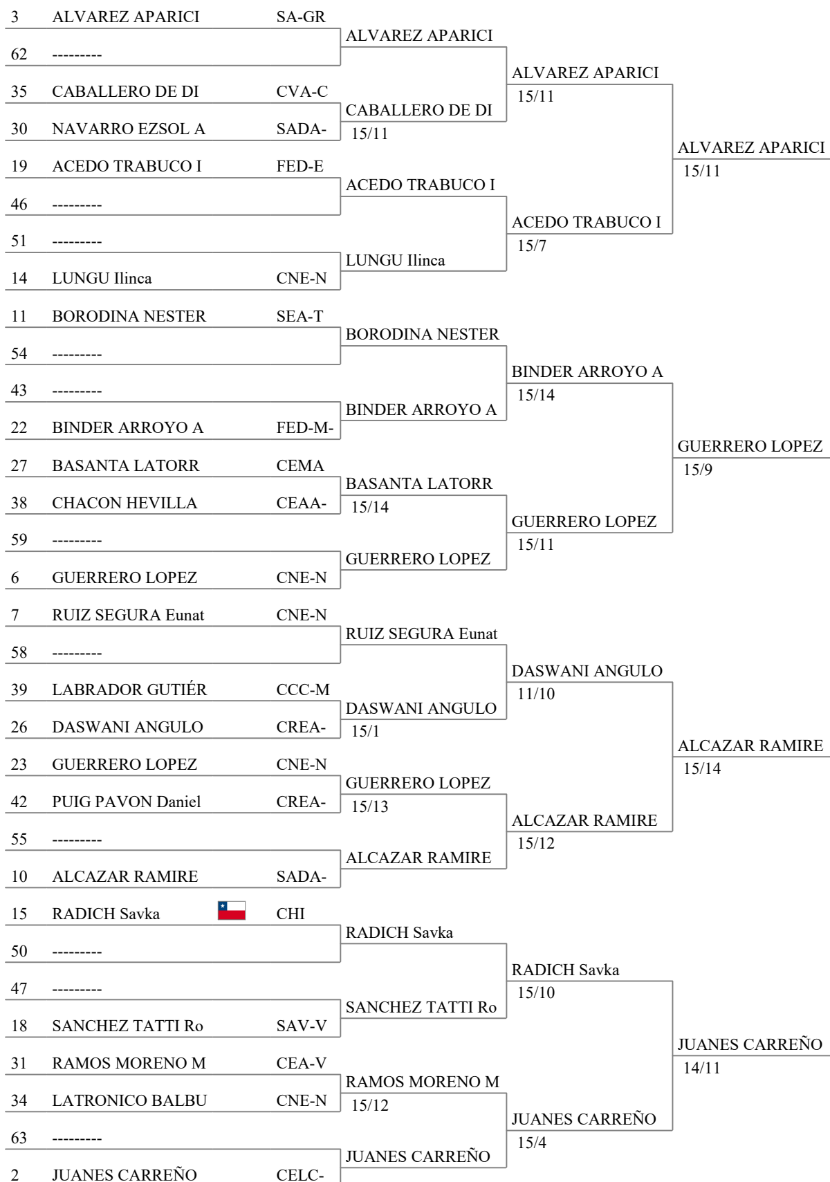
Tableau of 16