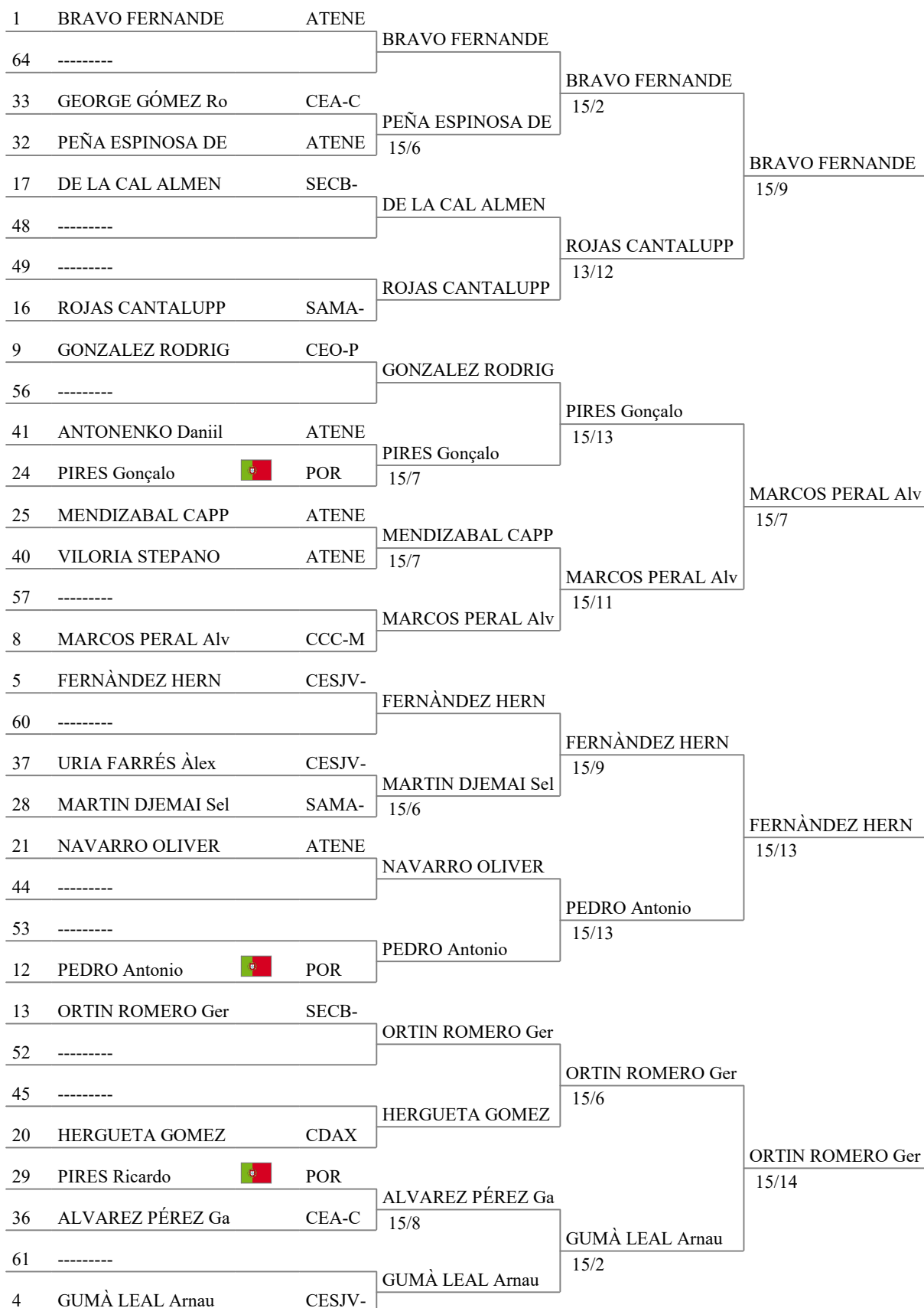
Tableau of 16