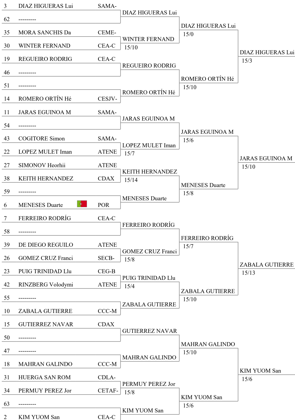
Tableau of 16