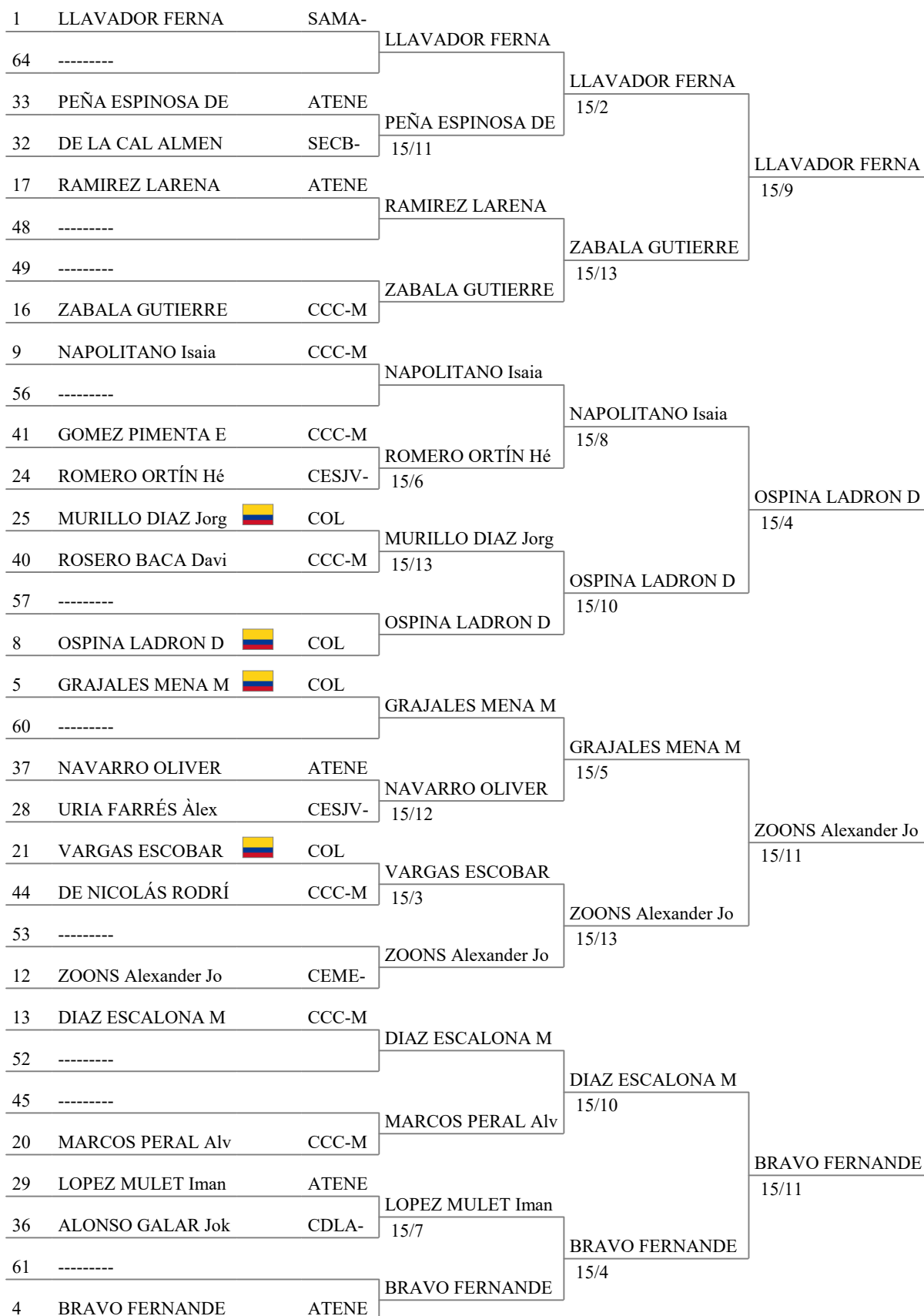
Tableau of 16