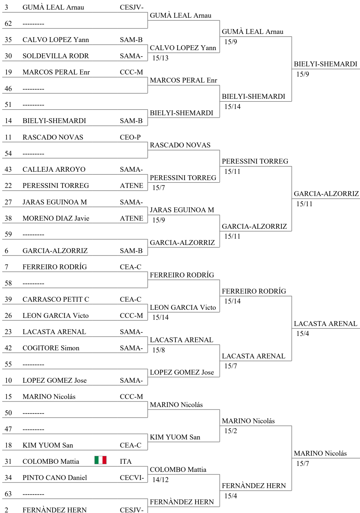
Tableau of 16