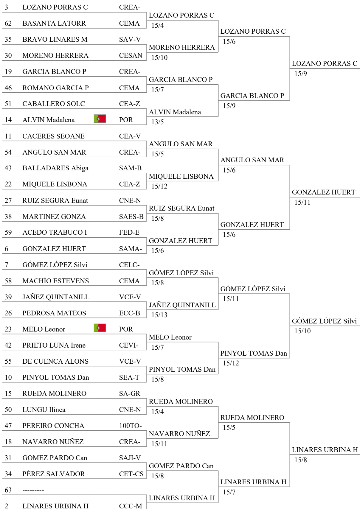
Tableau of 16