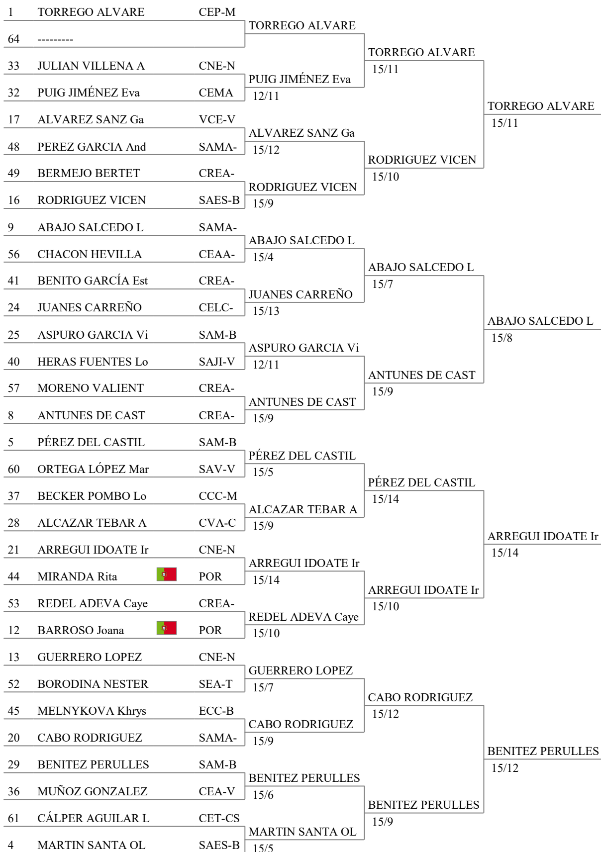
Tableau of 16