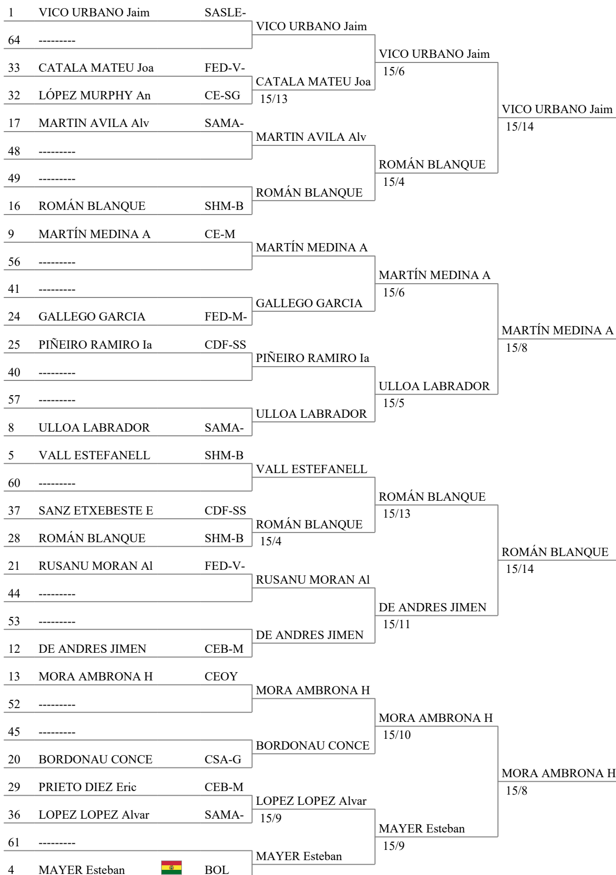
Tableau of 16