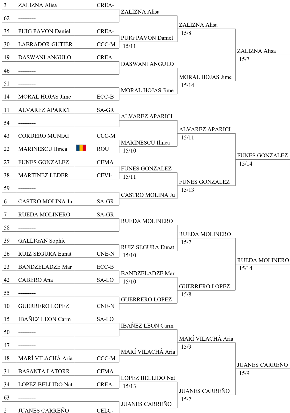
Tableau of 16