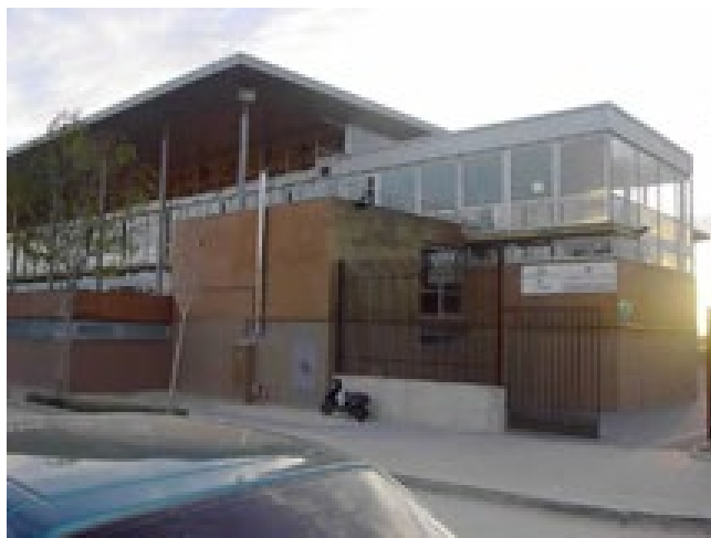
Pabellón Universitario de Albacete

PABELLON UNIVERSITARIO DE ALBACETE C/ Guillermina Medrano Aranda. 02006 ALBACETE