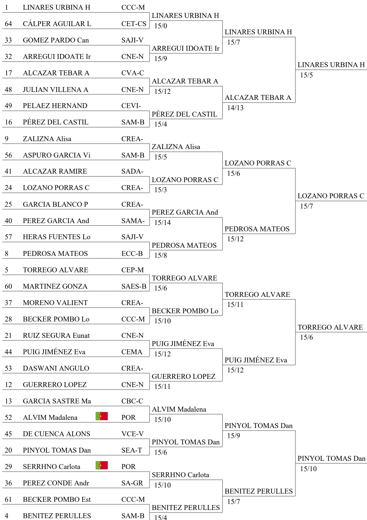
Tableau of 16