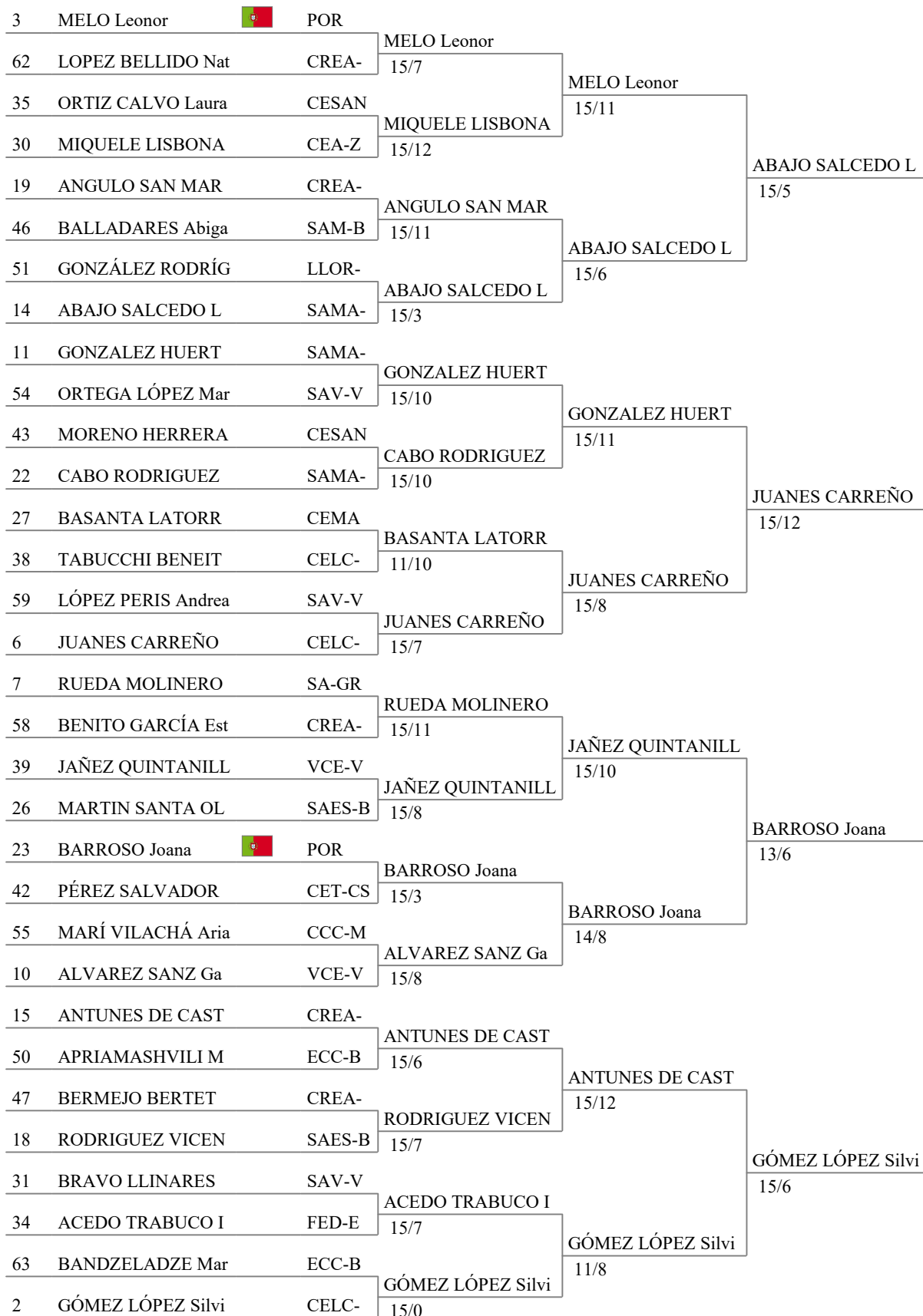
Tableau of 16